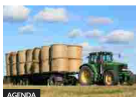
Gli imprenditori agromeccanici alle